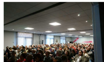
vergangene und bevorstehende Erfolge!