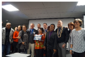
mit unserer Gruppe von Projektmanagern aus Neukaledonien