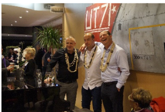
Die Gründer feiern

Wir möchten hier noch einige Bilder von unserem letzten Event teilen, welcher in der wunderschönen Stadt Bordeaux, in Frankreich, stattfand.