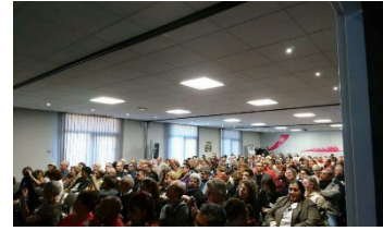
Succès passés et à venir!