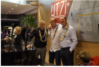
Les fondateurs font la fête