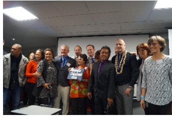
Avec le groupe de gestionnaires de projet de la Nouvelle Calédonie